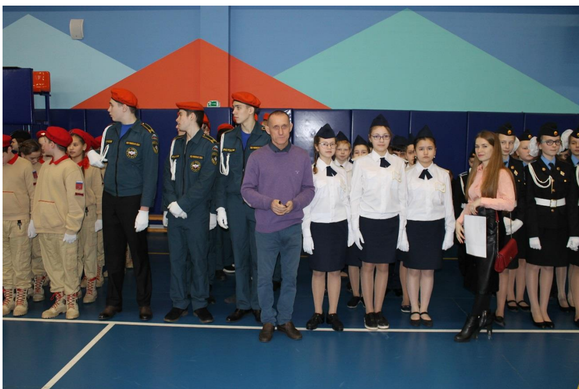
Кадеты Янинской школы на районном Слёте кадетских классов