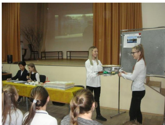
Представление творческого отчёта по Достопримечательностям Ленинградской области учениками 7-в